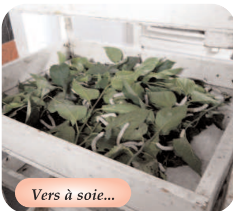
Vers à soie...